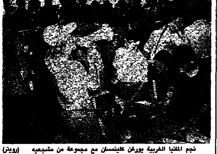
تجم المتبا الغربية يورغن كلينسمان مع مجموعة من مشجعيه